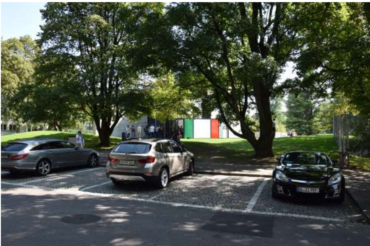
ankunft bei perfektem wetter, freundlichem personal und noch wenige besucher*innen, bevor es sich dann doch noch füllte und die hitze einem im wahrsten sinne des wortes den schweiß auf die stirn trieb... bei aller schönheit / architektonischer ästhetik – die thermische funktion des pavillons ist jenseits von gut und böse – und führt leider auch dazu, dass er im winter geschlossen bleibt...