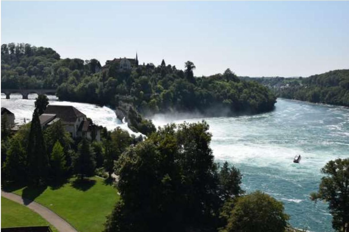
rheinfall auf dem weg nach zürich – und die reise war sicherlich kein reinfall!