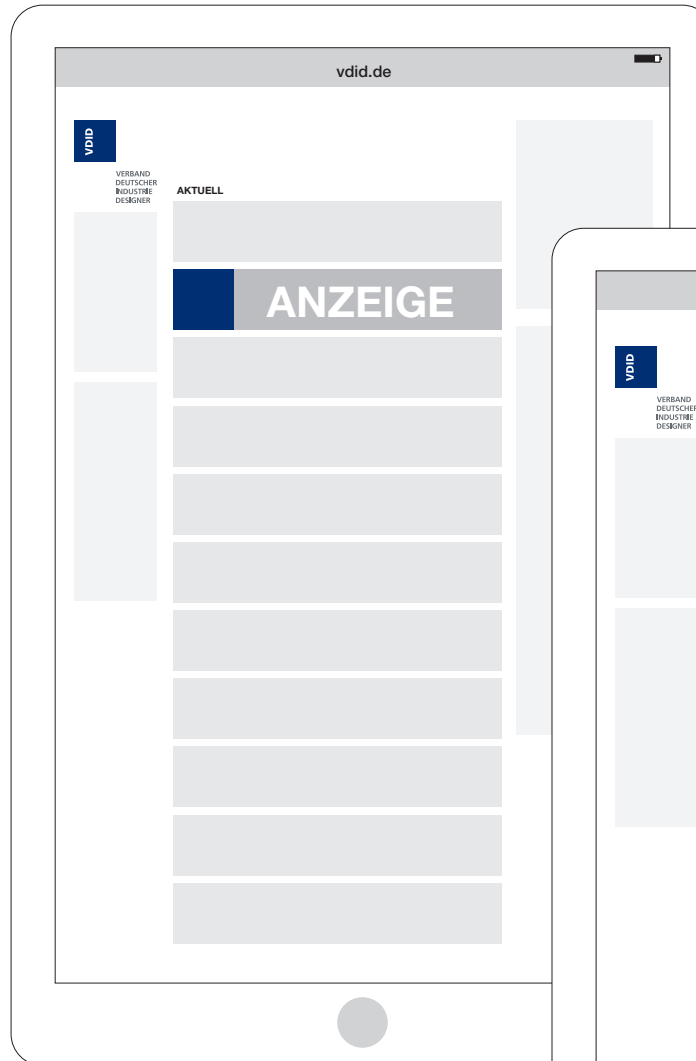
Ihre Anzeige in der Übersicht