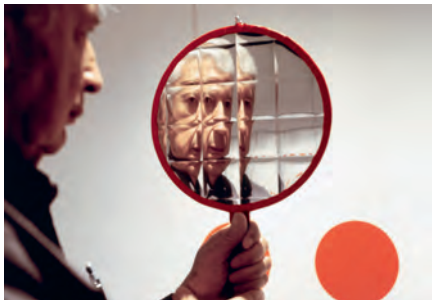
Julio Le Parc mit/with Double Miroir (Detail)

Julio Le Parc wurde 1928 in Mendoza, Argentinien geboren; er lebt und arbeitet in Cachan bei Paris. 1958 kam mit einem Stipendium als Kunststudent nach Paris und begründete die Groupe de Recherche d'Art Visuel (G.R.A.V.) mit. Zuvor studierte er u.a. bei Lucio Fontana an Academia de Altamira in Buenos Aires. Seit den 1960er Jahren wurde er weltweit ausgestellt; 1966 gewann er den Großen internationalen Preis für Malerei der 33. Biennale in Venedig. Die Kunststhalles Düsseldorf zeigte seine Arbeiten 1972 in einer Einzelausstellung. Besondere Würdigung erhielt sein Werk in den letzten Jahren durch große Einzelausstellungen im Palais de Tokyo in Paris, dem Met Breuer in New York und der Serpentine Gallery in London.