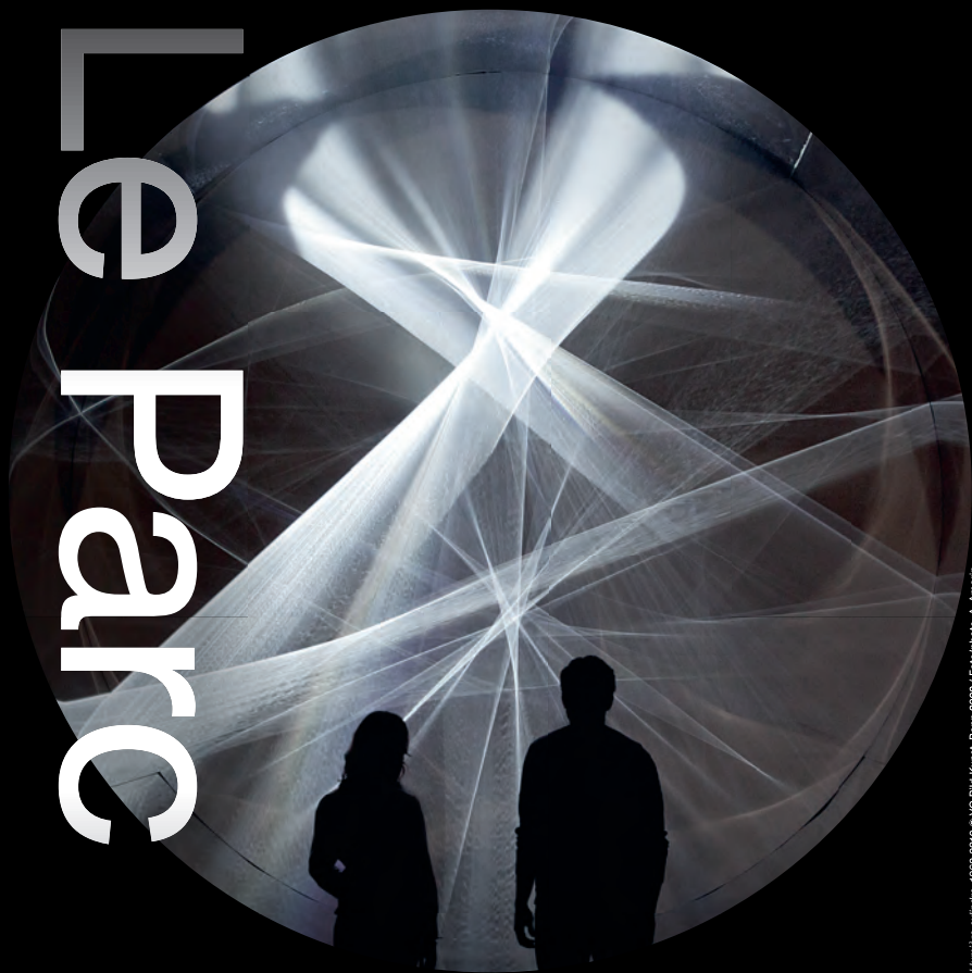
Julio Le Parc, Continuum lumineuse cylindrique, 1992-2012