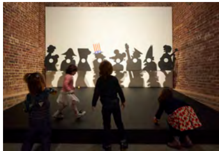
Julio Le Parc, Jeu-enquête Faites tomber les mythes (Stürzt die Mythen / Knock down the myths), 1969 Ausstellungsansicht / Installation view Serpentine Gallery, London 2014

Julio Le Parc was born in Mendoza, Argentina in 1928; he lives and works in Cachan near Paris. In 1958, he came to Paris on a scholarship as an art student and co-founded the Groupe de Recherche d'Art Visuel (G.R.A.V.). Before this, he had studied with, among others, Lucio Fontana at the Academia de Altamira in Buenos Aires. Since the 1960s his works have been exhibited worldwide, and in 1966 he won the Gran Premi for Painting at the 33rd Venice Biennale. The Kunststhalles Düsseldorf presented his work in a solo show in 1972. In recent years, his work has received special recognition through major solo exhibitions at the Palais de Tokyo in Paris, the Met Breuer in New York, and the Serpentine Gallery in London.