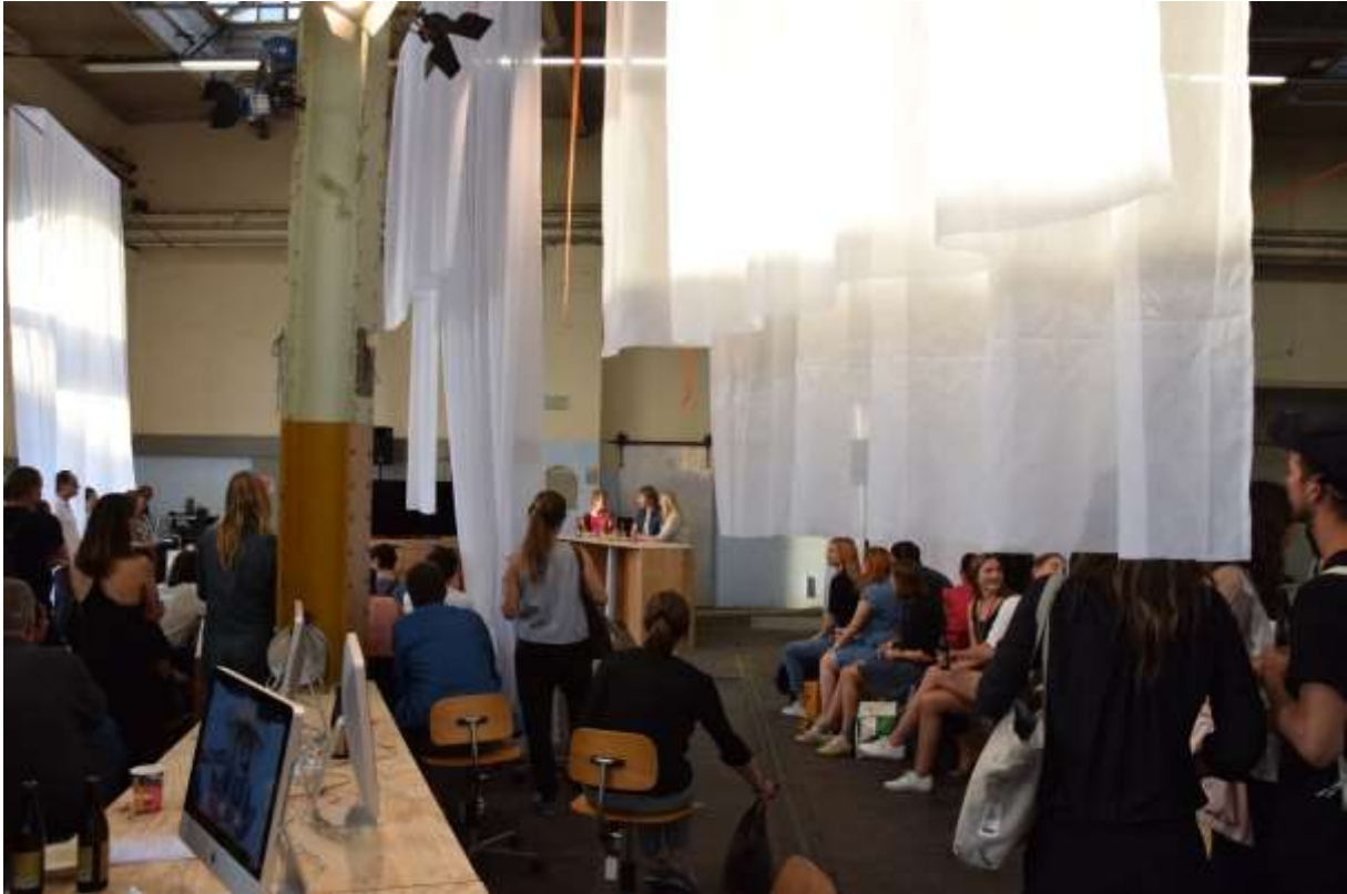
Eröffnungstalk, bei leider schwieriger Akustik – war schwer zu verfolgen – es gab aber dennoch viel zu sehen, erkunden und auszutauschen, mit den vielen und vielseitigen Besucher*innen.