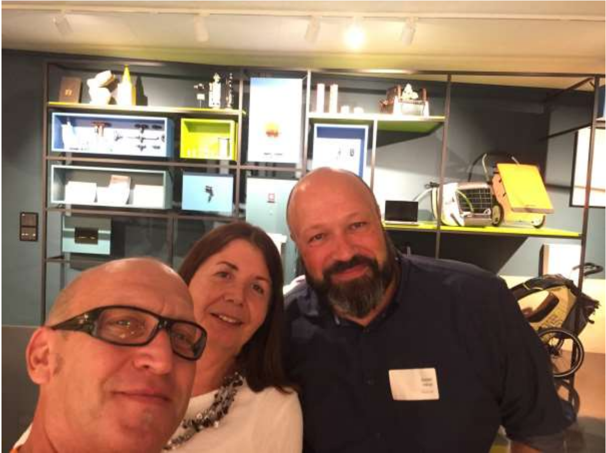
Zum Ende des Eröffnungstages der Design Biennale Zürich 2019 noch einen Besuch bei Tribecraft, um das 20-jährige Bestehen des Design- / Entwicklungsbüros zu feiern...