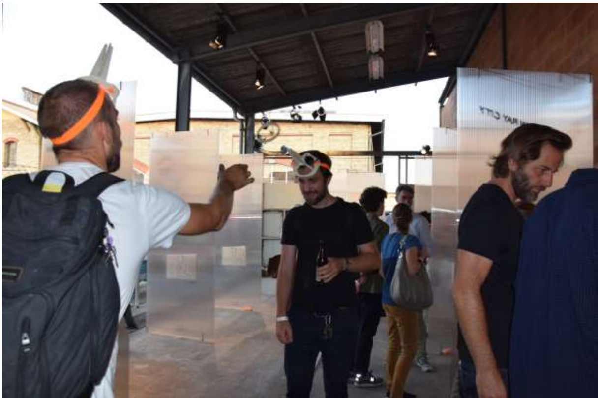
Geworfen – und gefangen oder getroffen...