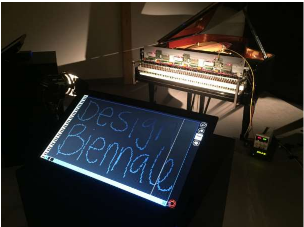
Tolle Installation! Mit 3 verschiedenen Interface-Schnittstellen konnte ein elektronisch kontrolliertes Piano zu neuen „Kompositionen“ u.a. auch zeichnerisch kontrolliert werden – wer es kann... !