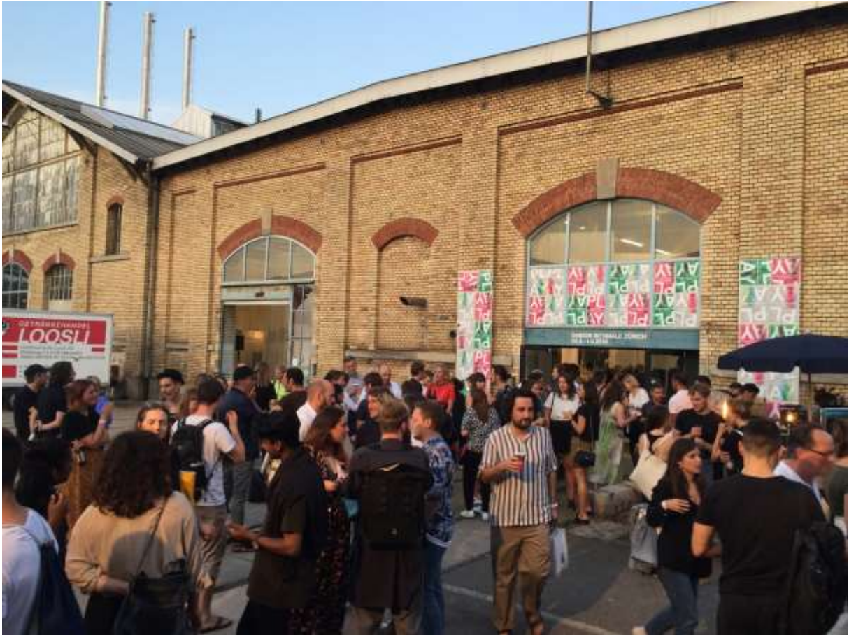
Eröffnung der 2. Design Biennale Zürich am Donnerstag, 29. Sept. 2019 in der Züricher Werkstadt.