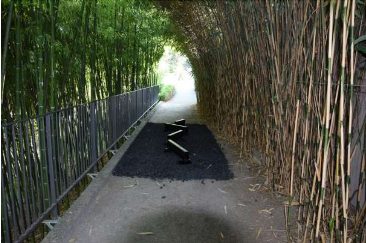
Tag 2 (nach der Eröffnung): u.a. im alten Botanischen Garten von Zürich – interaktive Installationen junger Gestalter*innen begangen...